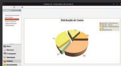
Distribuição de custos

É possível a criação de novos projetos em segundos, mas também pode, numa fase inicial, fazer simulações para apurar custos e proveitos, podendo mais tarde converter a simulação num projeto real.